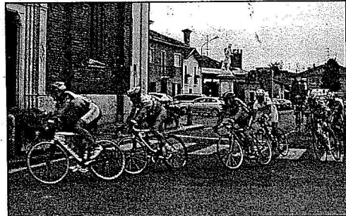
UN MOMENTO DELLA CORSA CICLISTICA DAVANTI ALLA CHIESA